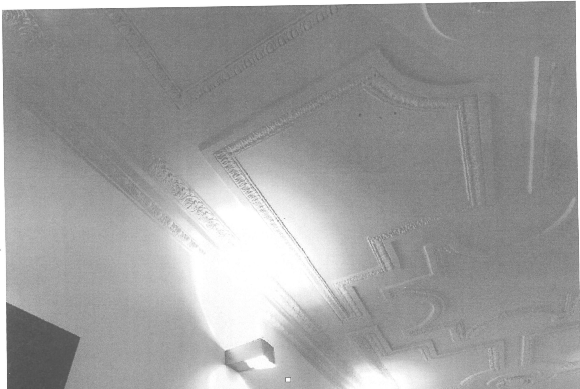
Handskizze | Deckenanschluss Stahlrohrrahmenelement | Beispiel Refektbau 2.OG Achse O Rauchabschnittstür mit Deckensturz neu F60 | ohne Eingriffe in Bestandsdecke F60 | entsprechend Brandschutzkonzept | Schließung der einzelnen Stuckrelieffelder 29.07.24 mb